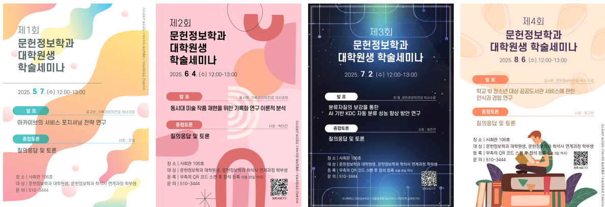
〈대학원 학술세미나 포스터〉