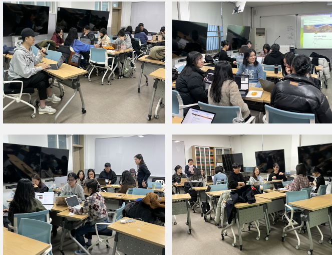
〈포스터 및 현장 사진〉