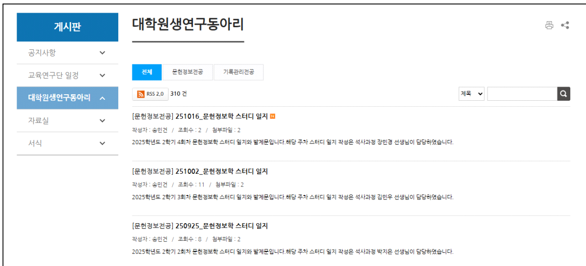
〈대학원생 연구동아리 결과 보고 탑재 화면〉